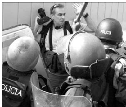
La brutalité est de mise, même contre les médias.

«Le Honduras n'a rien de démocratique», a constaté Bertha Oliva, militante des droits humains, lors d'une conférence à Zurich. «Le gouvernement n'a aucune légitimité; il n'a pas été élu par le peuple.» Le nouveau président, Porfirio Lobo, a été porté au pouvoir en novembre dernier, au terme d'élections orchestrées par les putschistes, supervisées par l'armée et largement boycottées par la population.