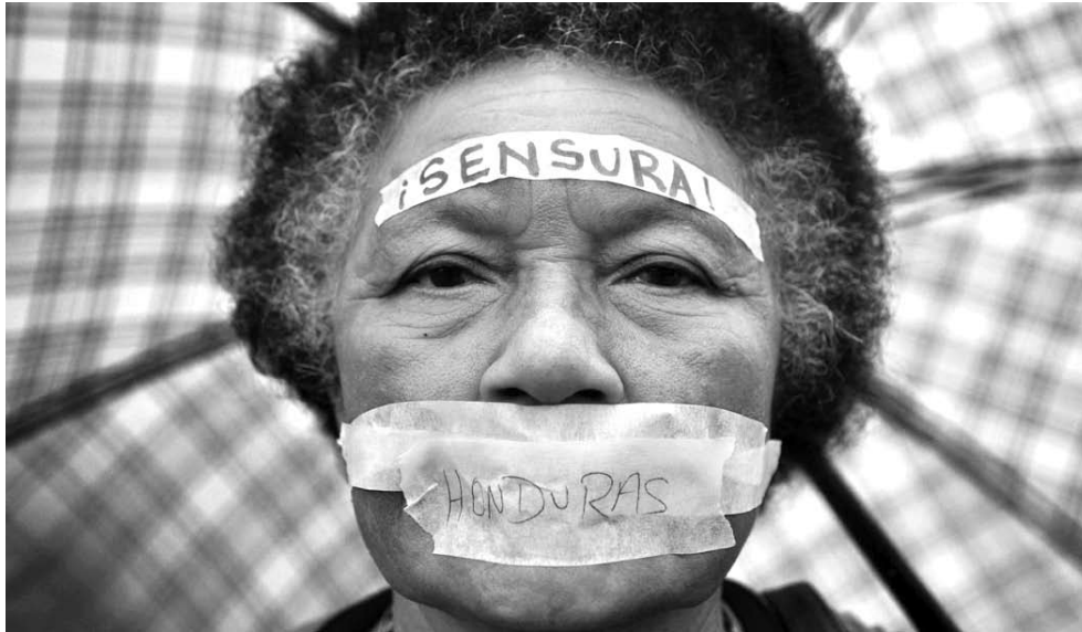
Le Honduras n'a pas besoin de censure, mais d'une voix pour le peuple.